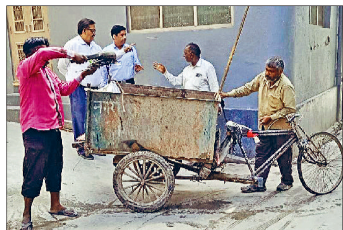
रेवाड़ी। वार्ड नोडल अधिकारी अपनी देखरेख में वार्ड में सफाई कार्य कराते हुए।