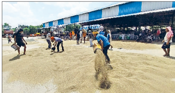
रेवाड़ी। अनाज में फड पर बाजरा सुखाते हुए पल्लेदार।

को सुबह के समय आसमान साफ रहा। दोपहर तक तेज धूप के कारण गर्मी ने एक बार फिर लोगों के पसीने छुड़ाने शुरू कर दिए। लगभग एक माह बाद अधिकतम तापमान 1.0 डिग्री की वृद्धि के साथ 36.5 डिग्री सेल्सियस पर पहुंच गया। न्यूनतम तापमान 0.5 डिग्री सेल्सियस बढ़कर 21.5 डिग्री सेल्सियस दर्ज किया गया। 8 अगस्त के बाद पहली बार तापमान इस स्तर पर पहुंचा है। हवा में नमी का स्तर कम होकर 55 फीसदी पर आ गया, हवाओं की