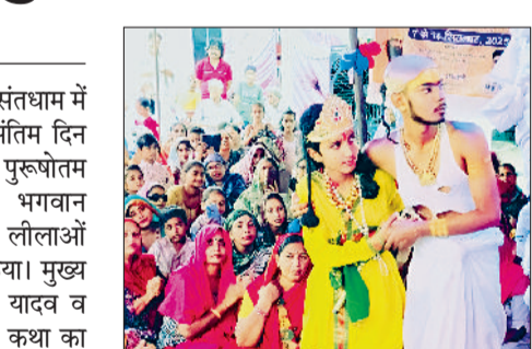
रेवाड़ी। कथा के दौरान श्रीकृष्ण-सुदामा की झांकी पेश करते बचे।