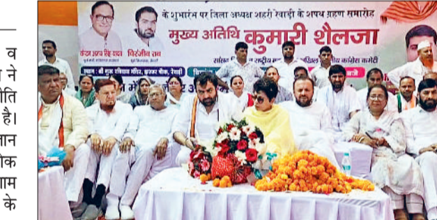
रेवाड़ी। कांग्रेस कार्यालय के उद्घाटन समारोह में मंचासीन कुमारी सैलजा व अन्य नेता तथा रविदास हॉस्टल में आयोजित कांग्रेस के समारोह में मौजूद कार्यकर्ता।

कुचलने पर आमादा है। राहुल गांधी के वोट चोरी के आरोप उन दस्तावेजों पर आधारित हैं, जो चुनाव आयोग की ओर से जारी किए गए हैं। आने वाले समय में यह मामला पूरी तरह साफ हो जाएगा। देश की जनता को लोकतंत्र बचाने के लिए जागरूक होकर आगे आने की जरूरत है। लोगों की जागरूकता से ही वोट चोरी के मामले का आने वाले समय में पर्दाफाश हो जाएगा। उन्होंने कहा कि भाजपा को संसद चलाने में भी कोई दिलचस्पी नहीं है। संसद में विपक्षी सांसदों को आवाज दबाई जाती है, जो लोकतंत्र के लिए खतरा है। यह सरकार लोकतंत्र के चौथे स्तंभ की आवाज को भी दबाना चाहती है। मीडियाकर्मियों पर केस दर्ज कराए जा रहे हैं, जो लोकतंत्र के लिए सबसे खतरनाक है। भाजपा की देश व प्रदेश दोनों सरकारों ने जनता के साथ छल