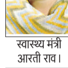
स्वास्थ्य मंत्री आरती राव।

हरियाणा सरकार की ओर से ग्रामीण क्षेत्रों में स्वास्थ्य सेवाओं के विस्तार और सुदृढ़ीकरण करने के लिए निरंतर प्रयास किए जा रहे हैं। स्वास्थ्य मंत्री आरती सिंह राव ने बताया कि रेवाड़ी जिले में 29 उप-स्वास्थ्य केंद्र और एम ब्लॉक पब्लिक हेल्थ यूनिट के निर्माण को प्रशासनिक स्वीकृति मिल गई है। उन्होंने बताया कि इन सभी स्वास्थ्य