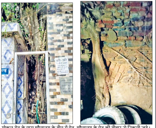
गोकल गेट के पास शौचालय के बीच में पेड़, शौचालय के पेड़ की दीवार से निकली जड़ें।