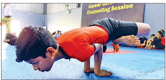
रेवाड़ी। योग कला का प्रदर्शन करता खिलाड़ी तथा फेंसिंग में मुकाबला करते खिलाड़ी।