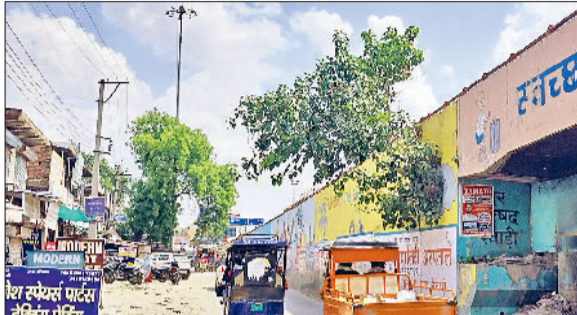
रेवाड़ी। नाईवाली ओवरब्रिज की दीवार में बढ़ता जा रहा पेड़, भाड़ावास गेट के ऊपर बढ़ रहा पेड़।